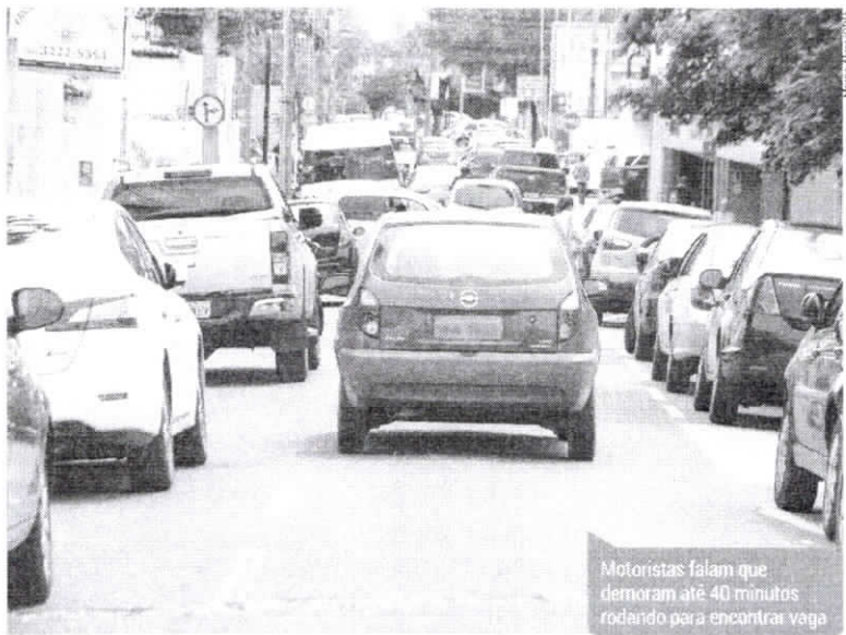
Motoristas falam que demoram até 40 minutos rodando para encontrar vaga