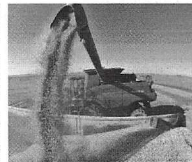
A soja deverá atingir a marca de 113 milhões de toneladas

Em relação à área plantada, a Conab projeta aumento de 0,3% em relação à última safra. Somente o plantio da soja deverá ocupar 1,1 milhão de hectares a mais que no ano passado.