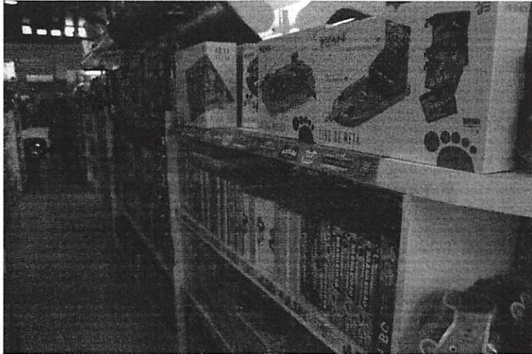
Os jogos de tabuleiro envolvem a participação de pelo menos dois jogadores, o exercício de estratégia e raciocínio lógico