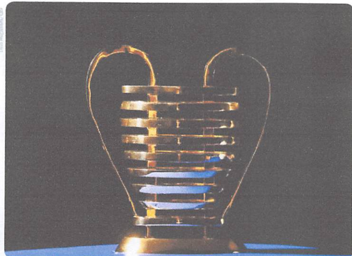
A FINAL ESTÁ PREVISTA PARA OS DIAS 19 DE ABRIL E 5 DE MAIO