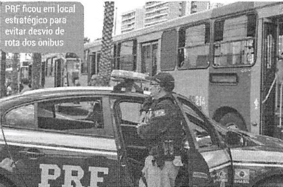
PRF ficou em local estratégico para evitar desvio de rota dos ônibus

Após uma série de denúncias sobre irregularidades no transporte público municipal e intermunicipal, a Polícia Rodoviária Federal (PRF), realizou na manhã de sexta-feira (19) uma nova blitz para fiscalizar as condições dos transportes de passageiros remunerados, incluindo coletivos municipais, intermunicipal e vans.