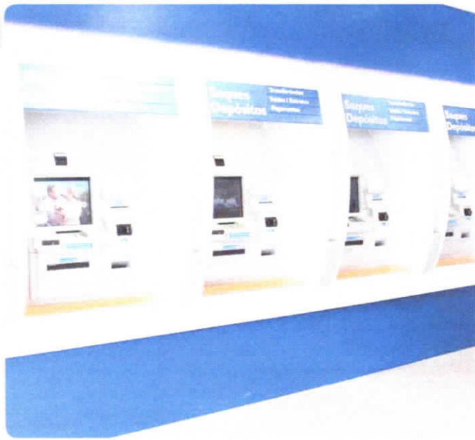
OS BANCOS RETOMAM O ATENDIMENTO NA QUARTA-FEIRA, 02, ÀS 12H