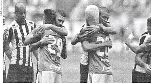
A campanha é a melhor do Palmeiras desde 2014, quando venceu os seis primeiros jogos da competição

Foi a quinta vitória consecutiva da equipe dirigida por Roger Machado, a única com 100% de aproveitamento neste início de Estadual. A campanha até o momento é a melhor do Palmeiras desde 2014, quando venceu os seis primeiros jogos da competição. Na oportunidade, porém, o time teve um ano decepcionante: foi eliminado na semifinal do Paulista para o Ituano, nas oitavas de final da Copa do Bra-