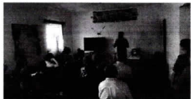
A programação inclui rodas de conversas, oficinas e atividades

A programação inclui rodas de conversas, oficinas e atividades dinâmicas. As ações acontecem no Centro de Atendimento Psicológico, bem como em diversos pontos da cidade, como Centro de Convivência e Fortalecimento de Vínculos, postos de Estratégia Saúde da Família, Academias