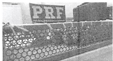
Após a apreensão, os animais foram entregues ao IBAMA

"O homem identificado como sendo o proprietário da mala informou aos policiais que não tinha licença para transportá-los e que por isso tinha colocado as aves naquela situação. Ele confirmou ainda que o destino para entrega dos pássaros era o Estado da Paraíba", relata o inspetor.