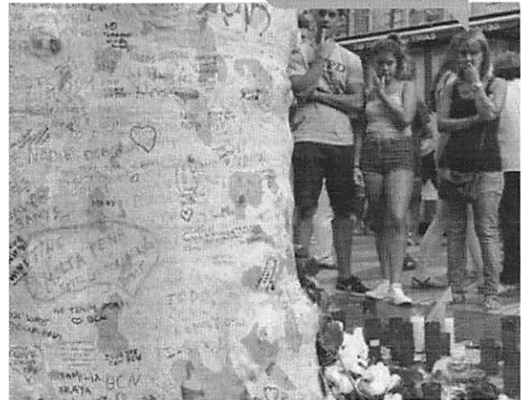
Dos 11 integrantes da célula terrorista, cinco foram mortos no atentado de Cambrils, quatro estão detidos e as autoridades sus-

Depois do ataque em Barcelona, terroristas atropelaram pedestres em Cambrils, matando outra pessoa. Os cinco autores foram mortos pela polícia.