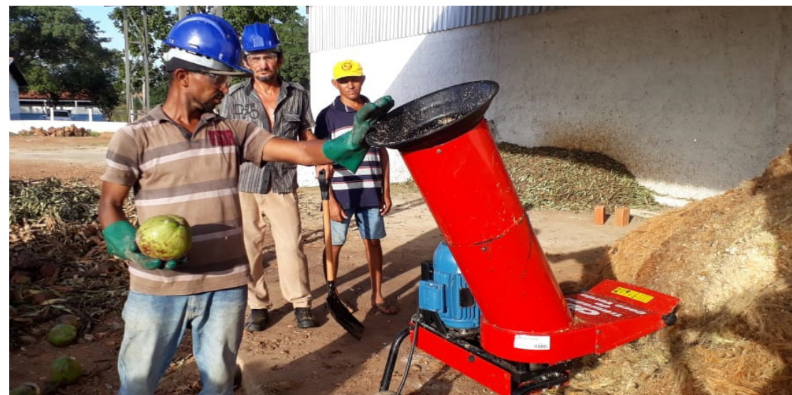
Projeto de reciclagem vem sendo referência para os demais municípios do Piauí