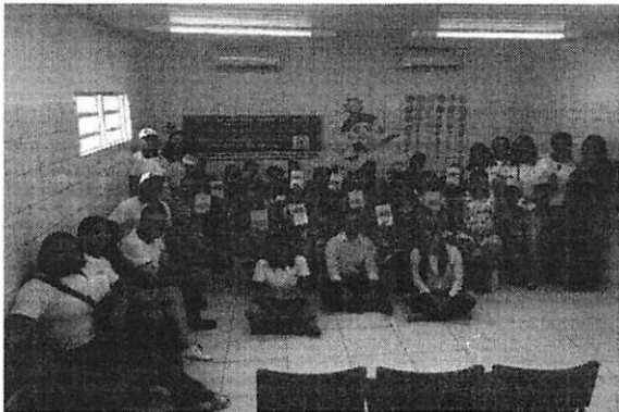
Município promove políticas para fortalecer a humanização do atendimento das gestantes

"O dia iniciou com um bate papo interativo sobre a temática, em duas das principais rádios do município. Na sequência, realizamos roda de conversa com gestantes que são atendidas nas Unidades Básicas de Saúde (UBS). Nas discussões, pontuamos sobre a necessidade de garantir mais