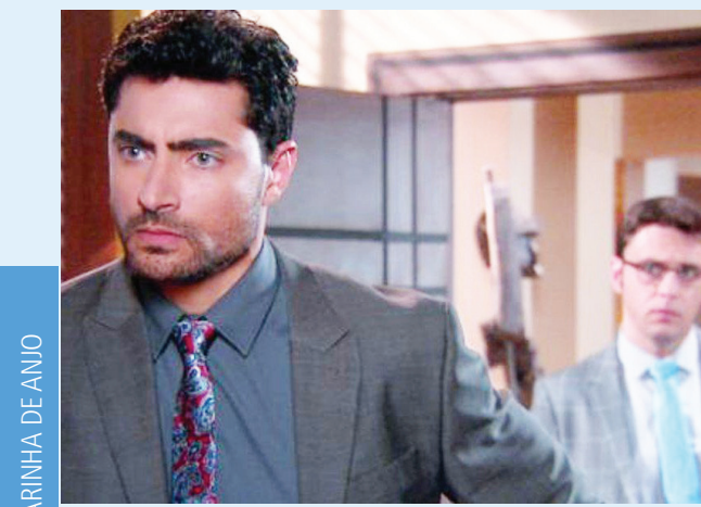
CARINHA DE ANJO