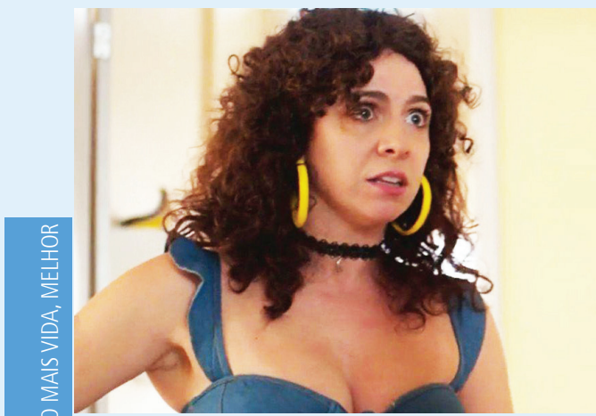
QUANTO MAIS VIDA, MELHOR