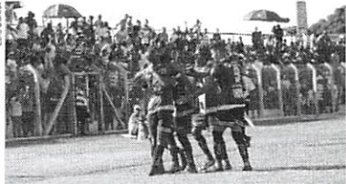
Jogadores comemoram mais um gol no Campeonato Piauiense

O time agora se prepara para enfrentar o River em jogo que acontece na quinta-feira (8)