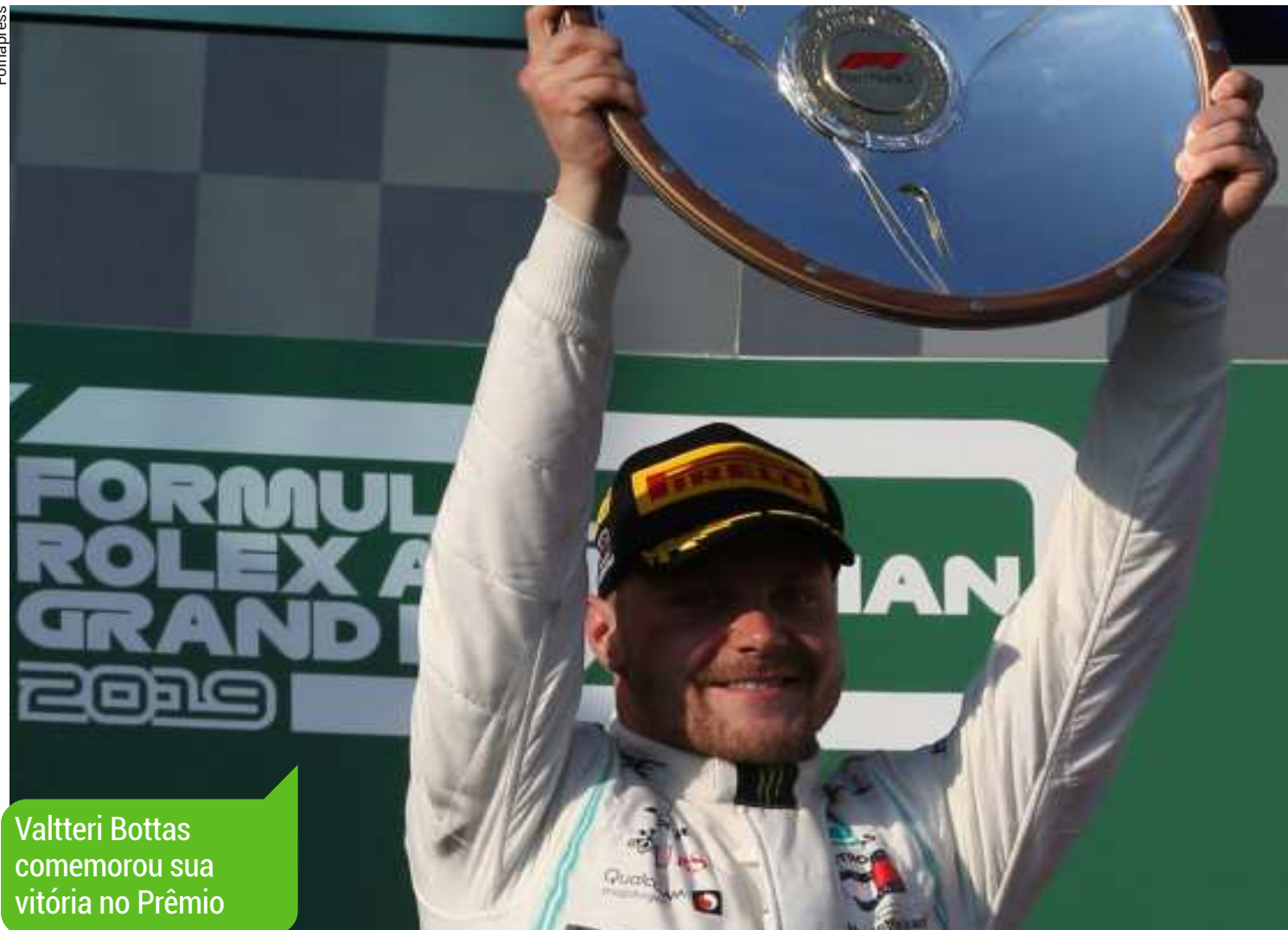
Valtteri Bottas comemorou sua vitória no Prêmio