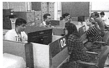
Agências da Caixa terão horário especial no fim de semana

Até a semana passada, R$ 16,6 bilhões foram resgatados por cerca de 10,6 milhões de cidadãos desde o início do calendário, no dia 10 de março.