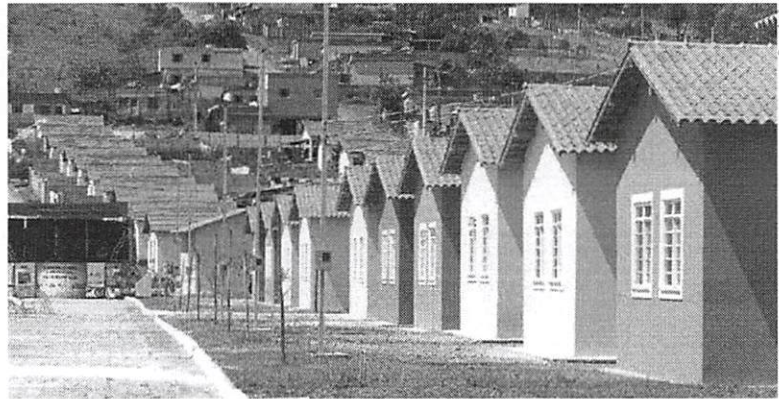
A pasta chegou a avaliar a possibilidade de remanejamento de recursos de uma linha de crédito para urbanização de favelas

Os juros variam de 7,85% (para clientes que tenham débito em conta ou conta-salário) a 8,85% ao ano. O valor máximo dos imóveis a serem financiados é de R$ 950 mil para Minas, Rio, São Paulo e Distrito Federal e de R$ 800 mil no restante do país. Não há limite de renda familiar.