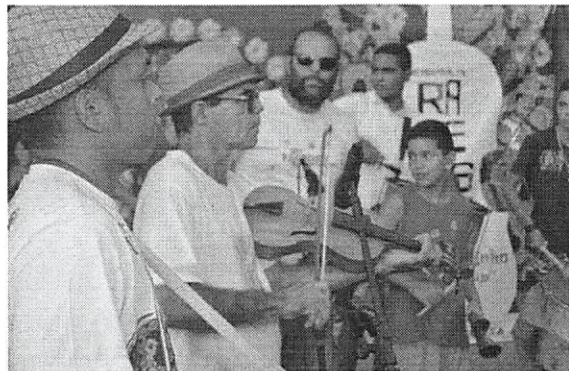
Um cortejo cultural percorreu as ruas de Bom Jesus, levando alegria à população por onde passava

Pouco mais de três dias de aula foram suficientes para revelar grandes talentos entre jovens de Bom Jesus. Eles participaram das dez oficinas do Circuito Cultura Viva, que aconteceram em duas escolas da cidade. Os resultados, foram apresentados no palco do Queijinho, nesse sábado (14), último dia do X Festival de Rabecas de Bom Jesus. Antes disso, um cortejo cultural percorreu as ruas de Bom Jesus, levando alegria por onde passava.