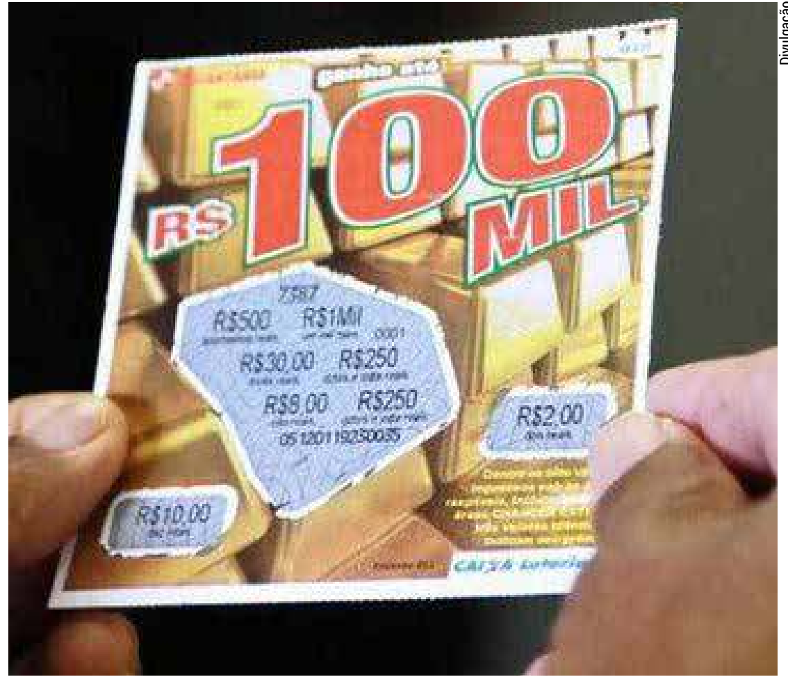
As novas raspadinhas estarão disponíveis ao consumidor até julho, de acordo com o consórcio

Segundo ele, a previsão de faturamento total com a operação supera os R$ 112 bilhões. A arrecadação máxima por