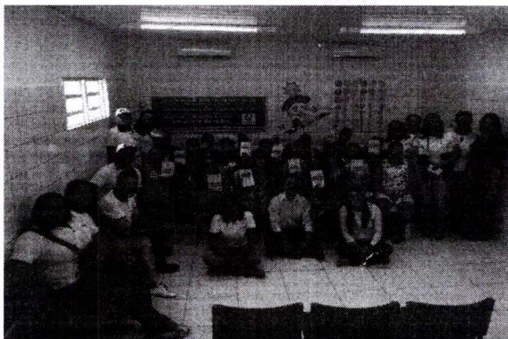
Município promove políticas para fortalecer a humanização do atendimento das gestantes

"O dia iniciou com um bate papo interativo sobre a temática, em duas das principais rádios do município. Na sequência, realizamos roda de conversa com gestantes que são atendidas nas Unidades Básicas de Saúde (UBSs). Nas discussões, pontuamos sobre a necessidade de garantir mais