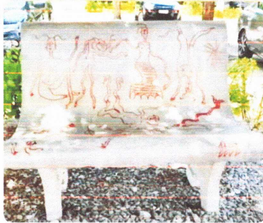
ESTUDANTES AFIRMARAM QUE O ALUNO APENAS EXPRESSOU SUA LIBERDADE ARTÍSTICA

O Portal O Dia procurou a UFdPar para obter um posicionamento, mas até o fechamento da matéria não obteve retorno. O espaço permanece aberto para esclarecimentos.